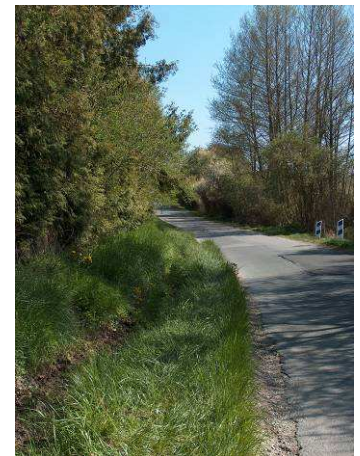
Mission accomplie !

Un grand merci à tous les participants !