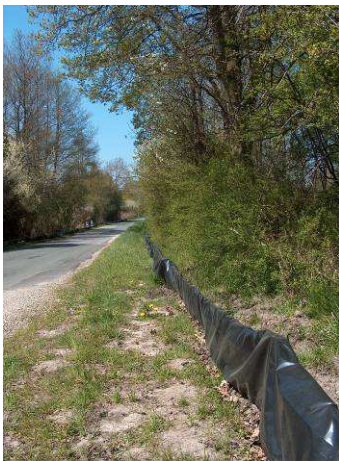
Ça n'a pas la même allure que sous la neige, ou de nuit...

Un temps magnifique nous a accompagnés pour le démontage du crapaudome de Condé-sur-Vesgre. Ce qui avait débuté par une journée glaciale au mois de février se termine donc par un après-midi estival. Des adhérents d'Atena 78 et d'AME, l'association de Condé partenaire de cette opération, et des sympathisants se sont retrouvés en début d'après-midi pour enlever toute trace de notre passage !