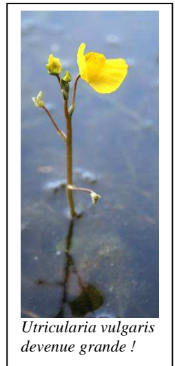
Utricularia vulgaris devenue grande !