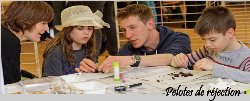
Pelotes de réjection