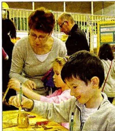
De nombreux ateliers sur le thème de la chouette étaient organisés.

Aussi, pas moins de neuf ateliers étaient proposés tels que des réalisations en pâte à sel, des masques, de "chouettes assiettes" ou encore de "chouettes pantins" dans le but de sensibiliser les plus jeunes de la nécessité de sauvegarder ces espèces animales.