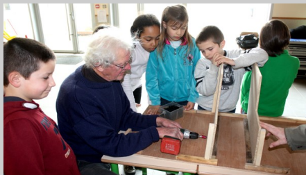
Au départ, chaque vis est difficile à engager et l'aide de l'adulte est nécessaire pour démarrer l'opération de vissage.

Le nichoir à SEPTEUIL est le 131ème installé en pays Mantois-Drouais.