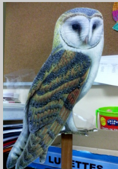
Effraie des clochers