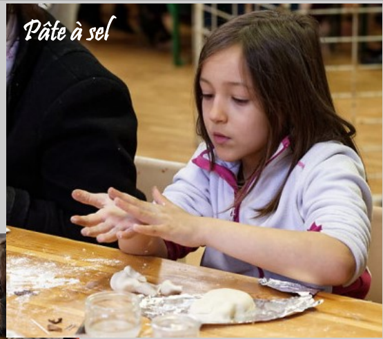
Pâte à sel