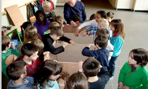
Le nichoir a été apporté en pièces détachées et la classe assemble les pièces du puzzle.

L'Effraie est en grande difficulté pour se reproduire, car les clochers qu'elle recherche en particulier sont grillagés, pour bloquer l'accès aux pigeons à l'origine de graves salissures. Mais par la même occasion, la porte est fermée à la Chouette effraie.