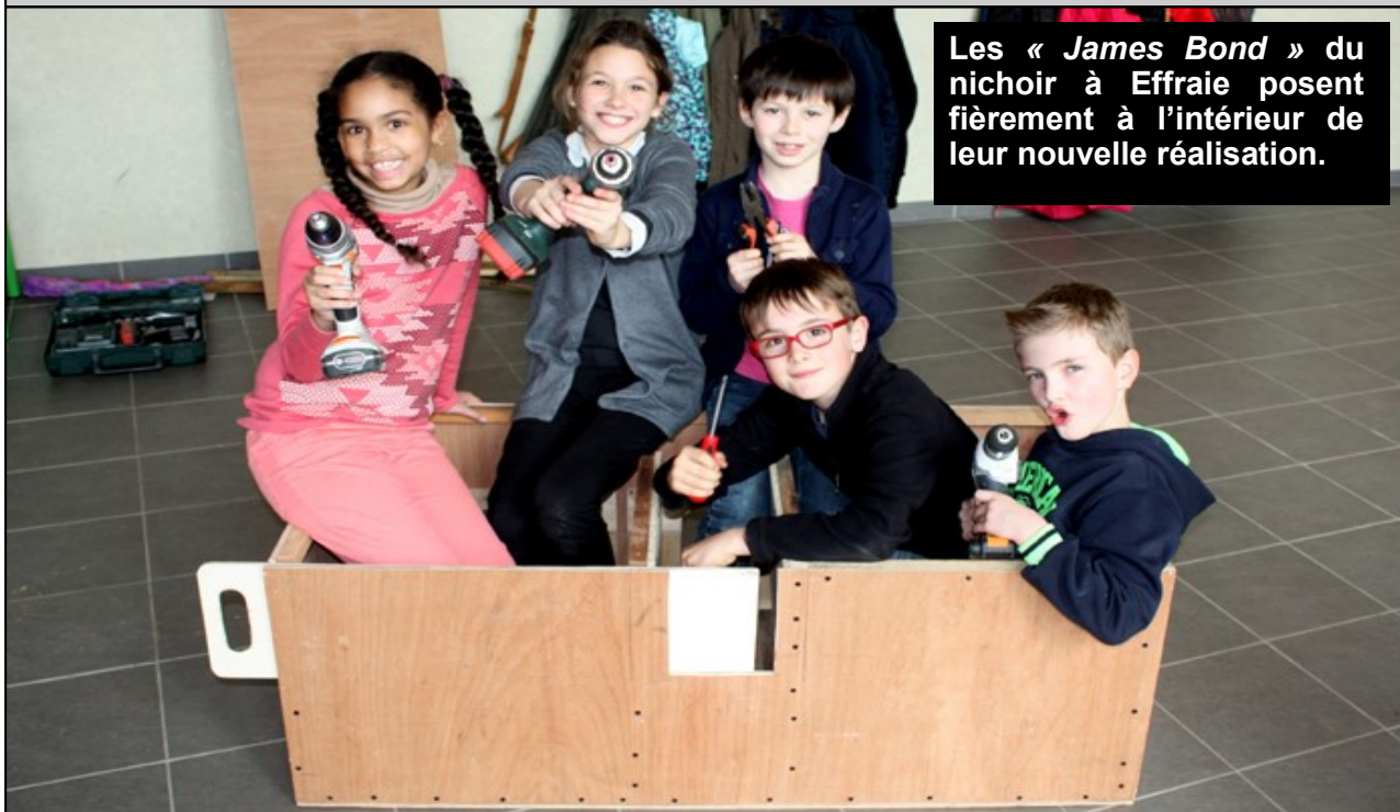
Les « James Bond » du nichoir à Effraie posent fièrement à l'intérieur de leur nouvelle réalisation.

Protéger l'Effraie des clochers, voir sur www.terroir-nature78.org « Rapaces nocturnes en Yvelines-protéger l'Effraie des clochers : Pourquoi ? Comment ? »