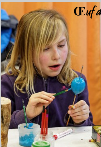
Œuf de Pâques