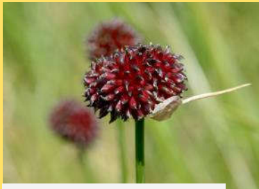
Ail à tête ronde Allium vineale

Parmi les espèces de plantes les plus nombreuses fleuries, nous observons: