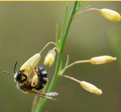
Halicte Halictus sp. sur Asperge Asparagus officinalis