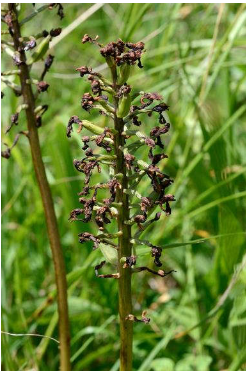
Orchis pourpre, Orchis purpurea desséché

Au printemps nous avons admiré une petite station d'Ophrys araignée Ophrys sphegodes .