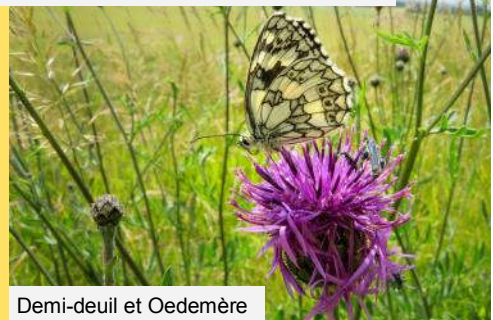
Demi-deuil et Oedemère Oedemera sur Centaurée centaurea scabiosa