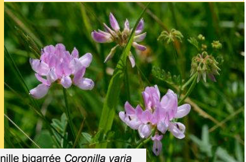
Coronille bigarrée Coronilla varia