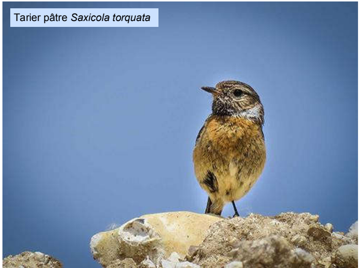
Tarrier pâtre Saxicola torquata

Les chants des Alouettes des champs Alauda arvensis et du Tarrier pâtre Saxicola torquata se sont fait entendre au niveau du dépôt de terre, avant d'arriver à la ferme de l'Orme.