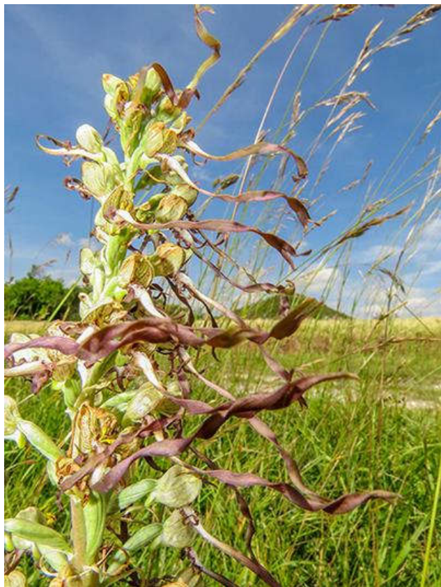
Orchis bouc, Himantoglossum hircinum