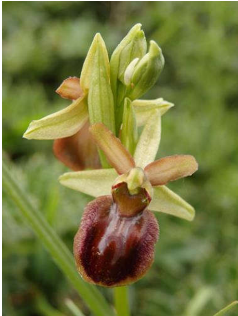
Ophrys araignée, Ophrys sphegodes