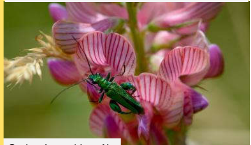
Oedemère noble mâle Oedemera-nobilis sur Sainfoin Onobrychis sativa