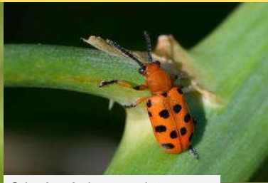
Criocère à douze points Crioceris-duode cimpunctata